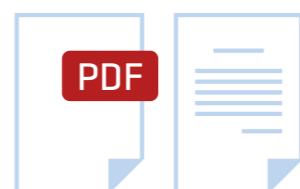
bildhafte Rechnungen im Format .pdf, .jpeg, .docx und Papierrechnungen gelten als sonstige Rechnungen

Auch wenn wir es hier mit einer regulatorischen Vorgabe zu tun haben, birgt sie diesmal großes Potenzial für effizientere Abläufe rund um die Rechnungsbearbeitung. Dass die Unternehmen nun flächendeckend in die Umsetzung der E-Rechnung kommen, wird als weiterer Treiber der digitalen Transformation im kaufmännischen Umfeld wirken und erhebliche positive Auswirkungen auf überholte, weil papierbasierte und nicht medienbruchfreie Prozesse in diesem Bereich mit sich bringen.